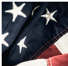
霸菱退伍軍人網路